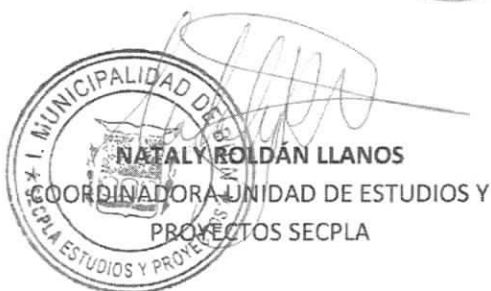
NATALY ROLDÁN LLANOS COORDINADORA UNIDAD DE ESTUDIOS Y PROYECTOS SECPLA