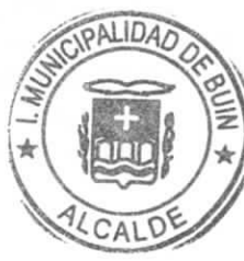
MIGUEL ARAYA LOBOS ALCALDE MUNICIPALIDAD DE BUIN