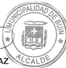
MIGUEL ARAYA LOBOS ALCALDE MUNICIPALIDAD DE BUIN