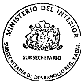
FRANCISCA ALEJANDRA PERALES FLORES