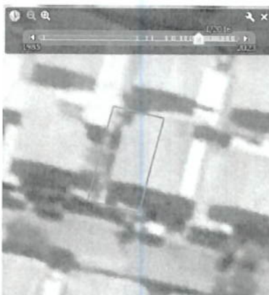
01/2016 NO SE APRECIA LA CONSTRUCCION AL COSTADO DE LA VIVIENDA

Según el Título I, Artículo 1, numeral 1, para acogerse a la Ley 20.898 la ampliación debe haber sido construidas antes de la publicación de la Ley 20.898 con fecha 04/02/2016; constatándose mediante vista satelital que la construcción por la cual se solicita regularización es posterior a la promulgación de la Ley 20.898.