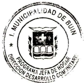
LISSETTE JASMIN SOTO FARIAS CORDINADOR /A PROGRAMA