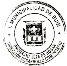
LISSETTE JASMIN SOTO FARIAS CORDINADOR /A PROGRAMA