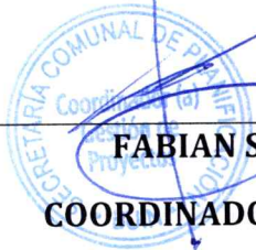
FABIAN SERRANO OLEA COORDINADOR DEL PROGRAMA