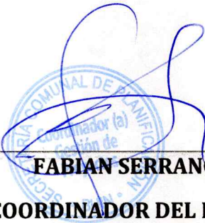
FABIAN SERRANO OLEA COORDINADOR DEL PROGRAMA