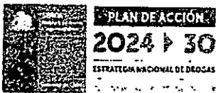
Indicador de Componente 3: