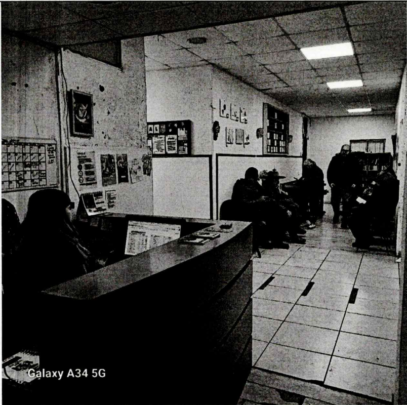
Galaxy A34 5G