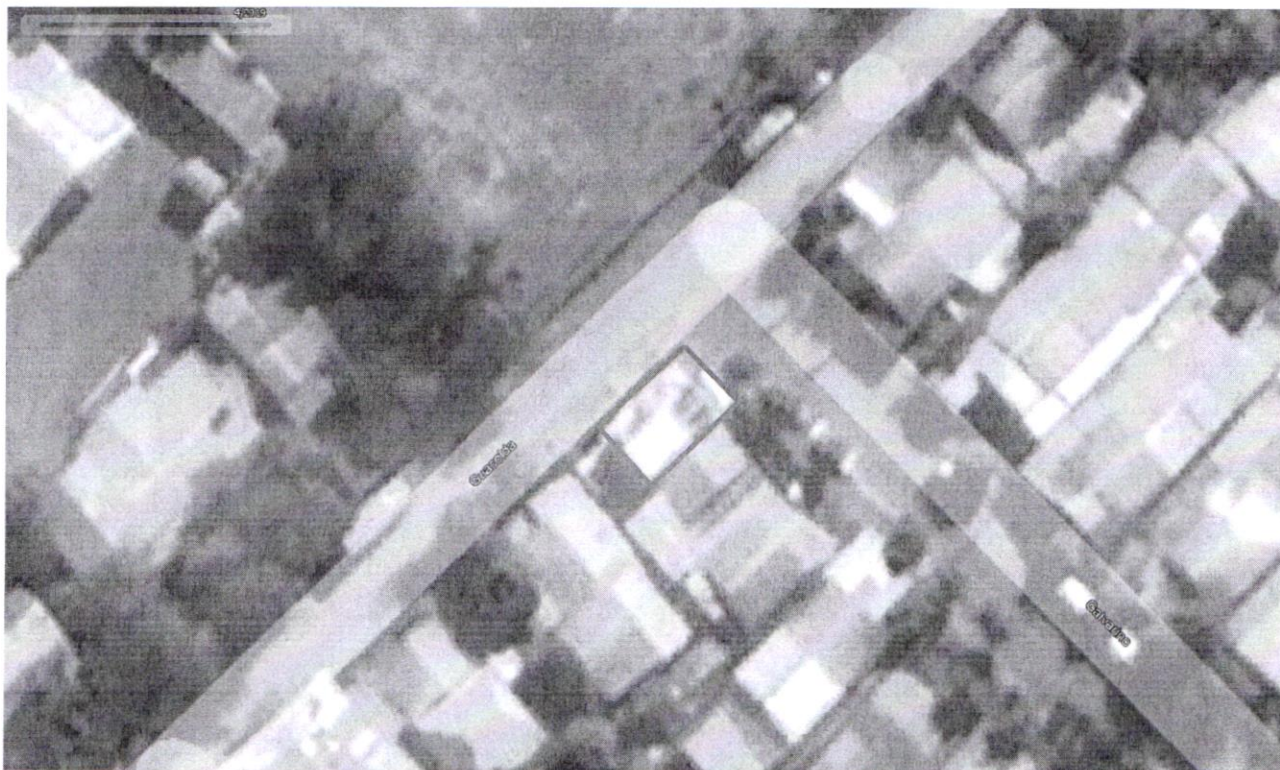
Imagen extraída a través de Google Earth con fecha de abril de 2019, Propiedad ubicada en Guacolda N°416 , comuna de Buin, con Roll SII N° 427-12 . (Se observan construcciones posteriores al 2016).