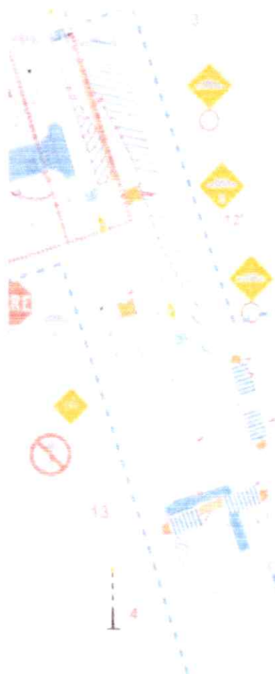
Imagen 5. Conexión Bajos de Matte hacia el norte. Extracto plano IVB proyecto Poeta Armando Uribe