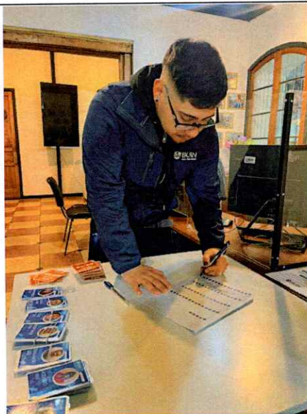
MIÉRCOLES 6 DE AGOSTO RECEPCIÓN DE PERSONAS PARA EL USO DE TRANSPORTE MUNICIPAL Y ENTREGA DE CREDENCIALES.